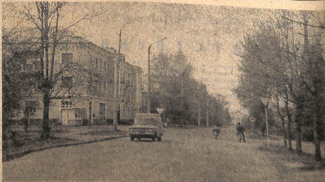
Улица Ленина 30 лет назад и теперь.